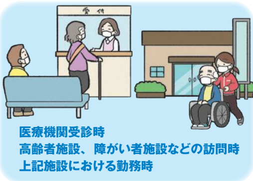
医療機関受診時 高齢者施設、障がい者施設などの訪問時 上記施設における勤務時