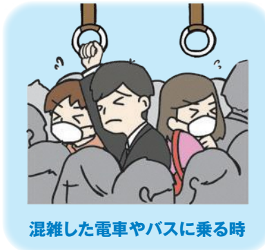
混雑した電車やバスに乗る時