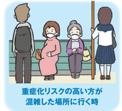
重症化リスクの高い方が 混雑した場所に行く時

■ 以下に該当する場合は外出を控え、やむを得ず外出する際にはマスクを着用します。