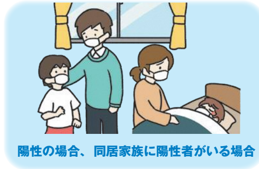
陽性の場合、同居家族に陽性者がいる場合