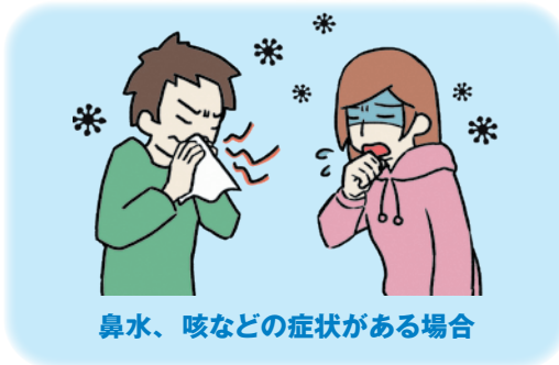
鼻水、咳などの症状がある場合

■ 以下に該当する場合は外出を控え、やむを得ず外出する際にはマスクを着用します。